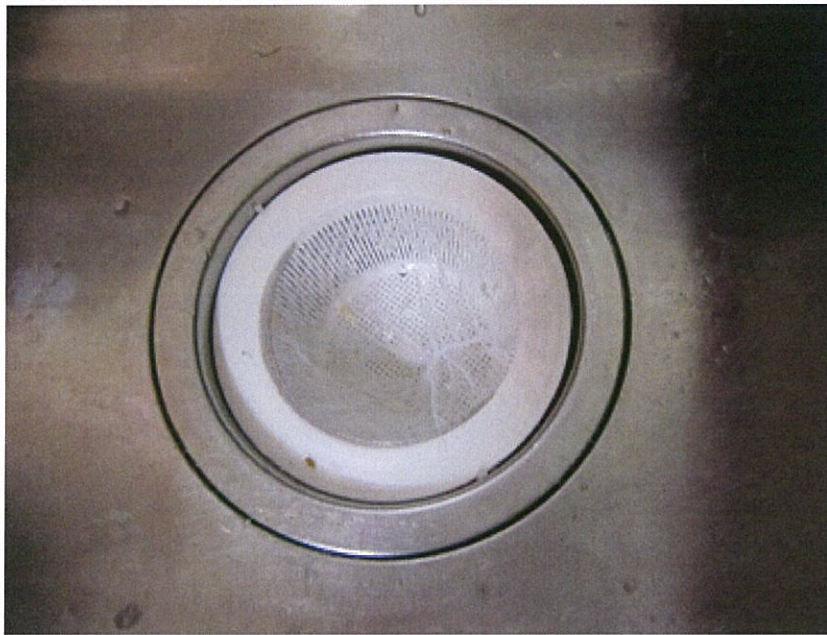
写真・1 試験の様子（ぬめり制御効果の評価試験）